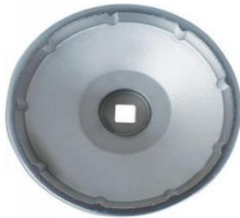
Z-4435 Oliefiltersleutel Maat: 97 mm 9-kant Geschikt voor VAG (Audi, Seat, Skoda en Volkswagen) met 10 cilinder dieselmotoren, zoals Phaeton en Touareg