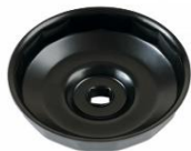
Z-6607 Oliefiltersleutel 107mm x 15 kant Geschikt voor Iveco, Renault, Scania en Volvo vrachtwagen