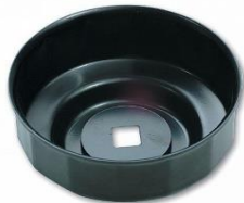
Z-3411 Oliefilter sleutel 95 mm x 15-kant. Ford Transit