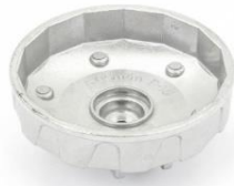
1130-15-ML Oliefilter dopsleutel 94,5mm x 15 kant 94,5mmx 15kant Ford (busjes), Nissan