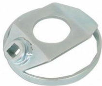
Z-4436 Oliefiltersleutel Maat: 102 mm x 14-kant Geschikt voor GM (General Motors). 3.0lt Aluminium uitvoering