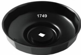
1749 Oliefiltersleutel 95mm x 15 kant Ford Transit.