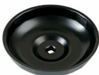
Z-6608 Oliefiltersleutel 135 x 18 kant Geschikt voor MAN 18 - 40 ton bij Series 406, 414, 440, 460 FE en TGA vrachtwagens